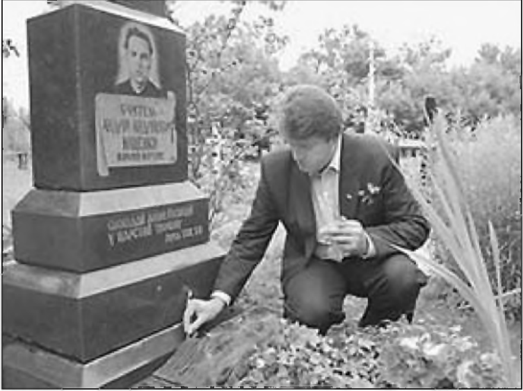
Виктор Ющенко возле могилы отца в Хоружевке