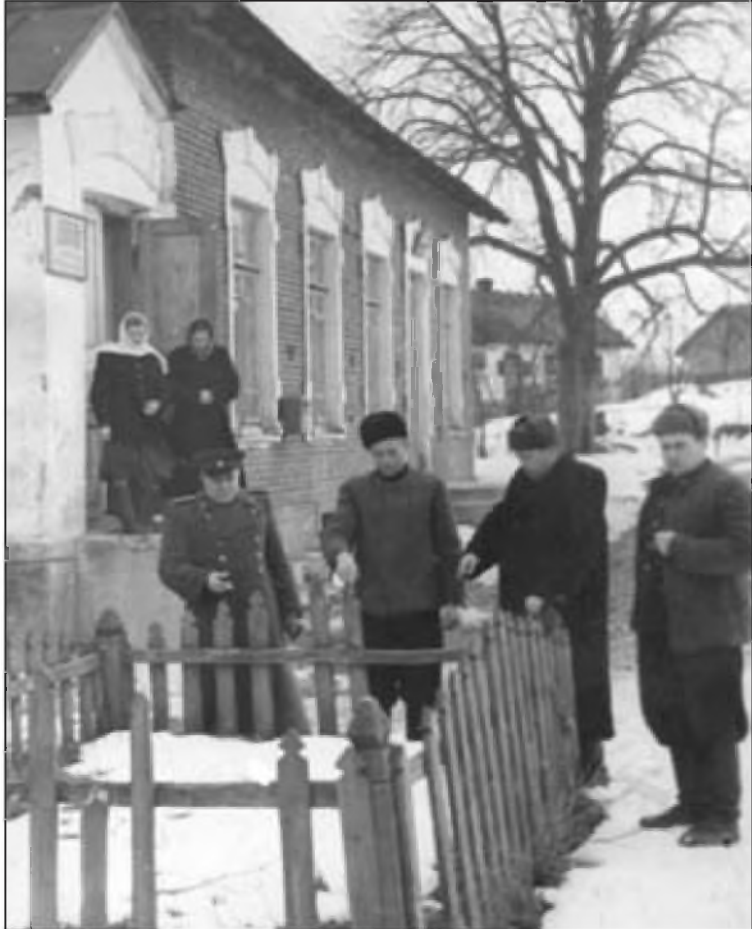
Дом, в котором размещалась «Служба безпеки» ОУН. В этом колодце тоже были найдены останки жертв

Всього в цьому селі за роки німецької окупації і в перші роки після визволення села Радянською Армією оунівськими бандитами замучено і вбито понад 450 чоловік» 44 .