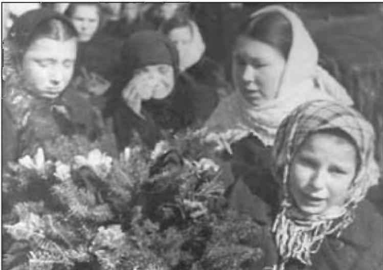
Дерманцы оплакивают односельчан, погибших от рук оуновских боевиков