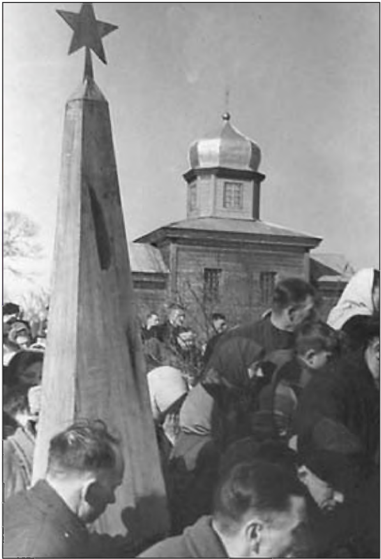
Обелиск для братской могилы