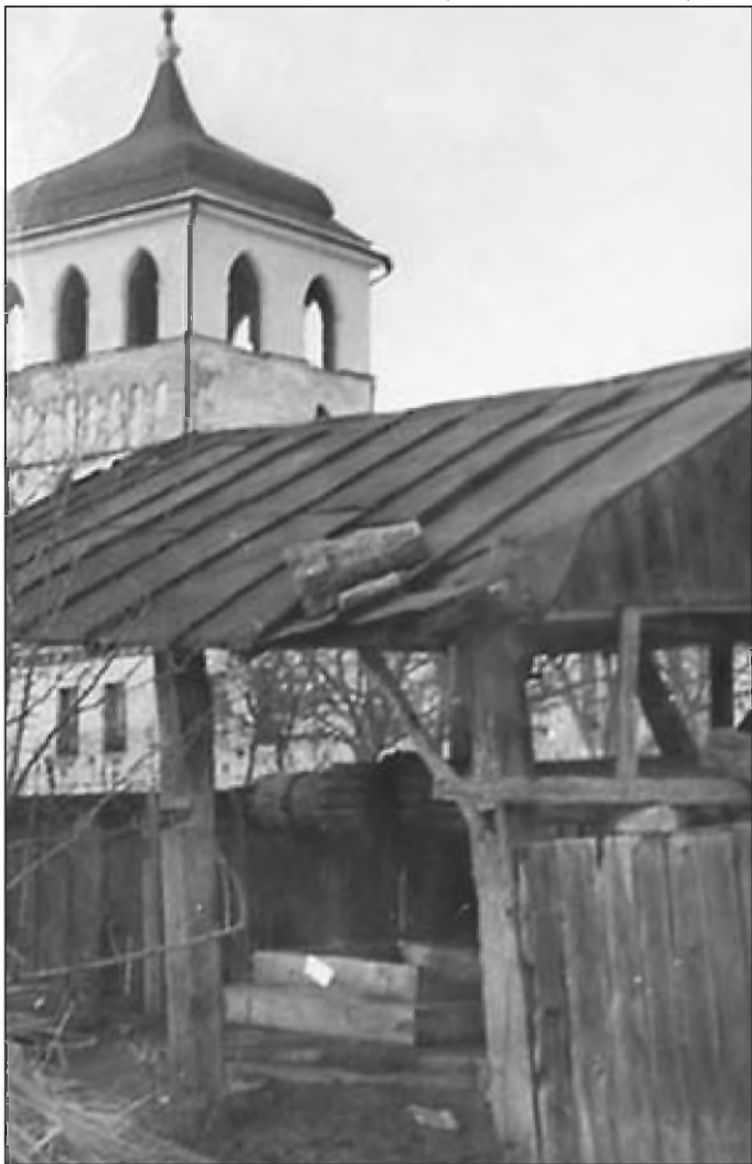
Колодец на территории Дерманского монастыря, в котором находился оуновский схрон. В стенах были прорыты большие норы — монахи помогали боевикам скрываться